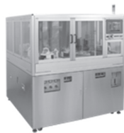
コータデベロッパ